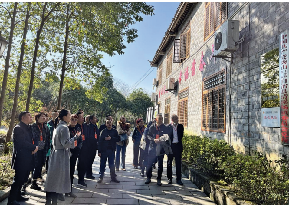
近日, 秀山自治縣政協組織社法民宗委委員活動小組到清溪場街道和隘口鎮開展重點民生實事項目推進情況視察活動, 並積極建言獻策。