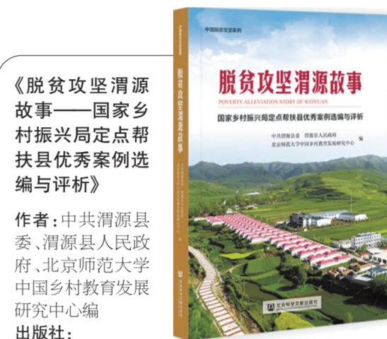
《脱贫攻坚渭源故事——国家乡村振兴局定点帮扶县优秀案例选编与评析》 作者：中共渭源县委、渭源县人民政府、北京师范大学中国乡村教育发展研究中心编 出版社：社会科学文献出版社

内容简介：小说艺术性地再现了20世纪初的俄国革命运动。书中表现出工人阶级逐渐觉醒、工人运动蓬勃发展的情景，振奋人心、鼓舞斗志。