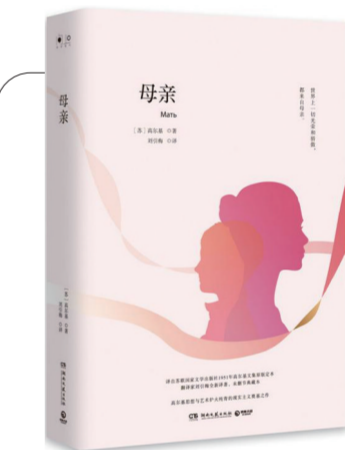
《母亲》 作者：[苏]高尔基 出版社：湖南文艺出版社

内容简介：本书用京剧“行话”和中国文化独有的哲学和美学思维，通俗生动地阐释京剧的美学特征，讲好中国京剧的故事。