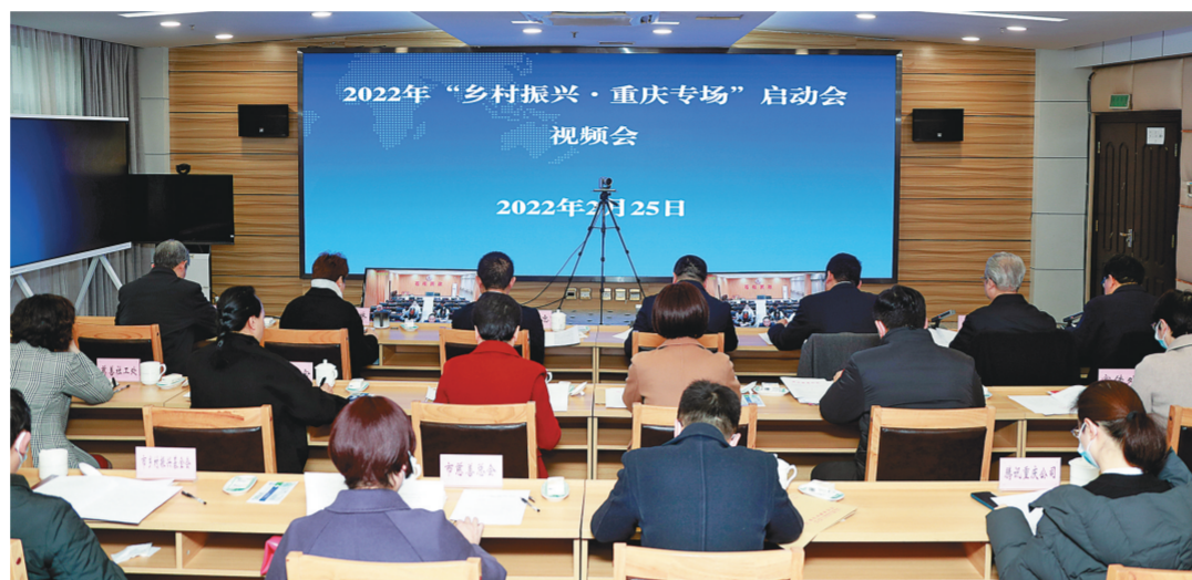
2022年“乡村振兴·重庆专场”启动会视频会现场

从初步尝试到全面参与,从1元到11.33亿元,从实践到应用理论研究,近年来,市慈善总会积极探索“互联网+慈善”,互联网公益实现了零的突破和历史性飞跃。透过独具特色的互联网募捐模式,市慈善总会渐渐摸索出“指尖聚善”的初型。