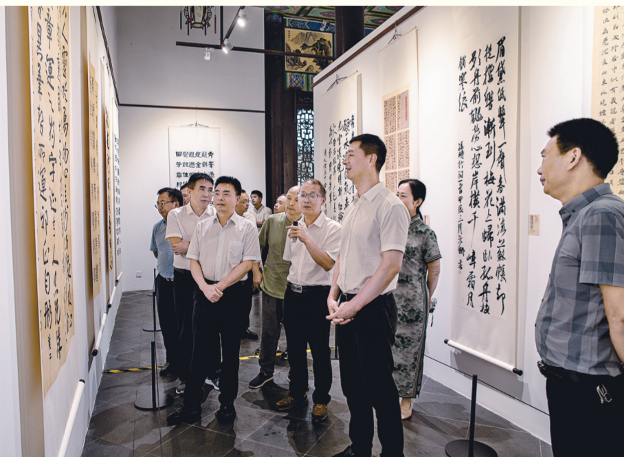
7月1日，由重庆市璧山区、四川省简阳市两地政协共同举办的“双城初心驻古道翰墨香”书画联展在璧山开展。本次书画联展共展出作品100幅，或描绘秀丽山川，或书写地域人文，展现了巴蜀儿女奋进新征程、建功新时代的凌云壮志和对美好生活的向往。